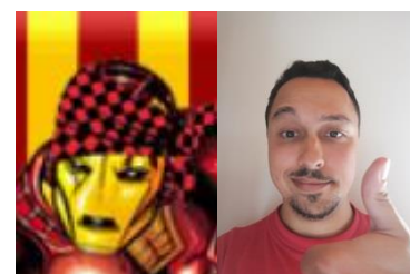
Maestro Patrocinador Tortugokamikaze