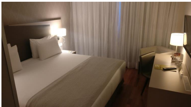
Habitación doble (matrimonio)

Las habitaciones dobles pueden ser de matrimonio (cama de 2x2m) o dos camas separadas (10 habitaciones). Las individuales son con cama de matrimonio de 1,5x2m.