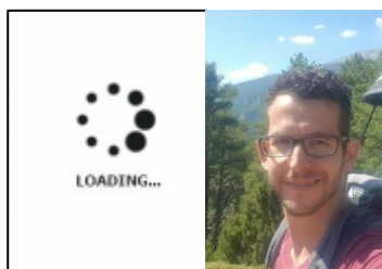
Maestro Autorolero IzVe