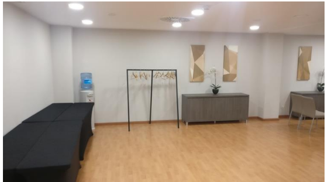
Vista no patrocinada del salón