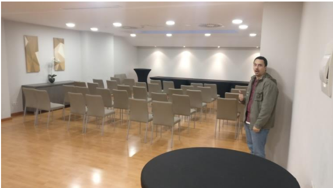
Vista patrocinada del salón

En el sótano del hotel sin habitaciones muy cerca, por lo que las posibilidades de molestar son bajas, pero se nos ha pedido “prudencia” entre las 21:00 y las 9:00. El salón tiene 85 m 2 y un aforo de 65 personas en “modo banquete”. Podremos indicarles cómo queremos que distribuyan mesas y sillas. Nos pondrán una fuente con agua y bidones que irán reponiendo, stay hydrated .